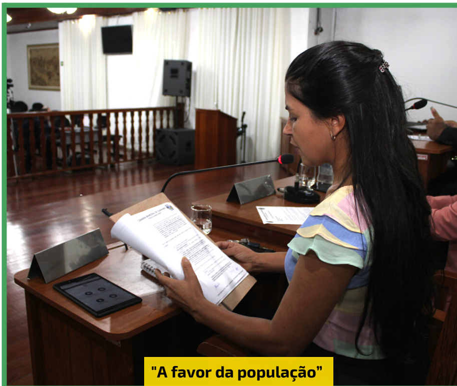
"A favor da população"

➔ Aprovado PL que permite o credenciamento de MEI para prestação de serviços ( Pág. 3)